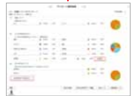
リアルタイムアンケート集計

※「アンケートPRO」はエクスウェア(株)が提供するMOMONGAアンケートサービスの一つです。